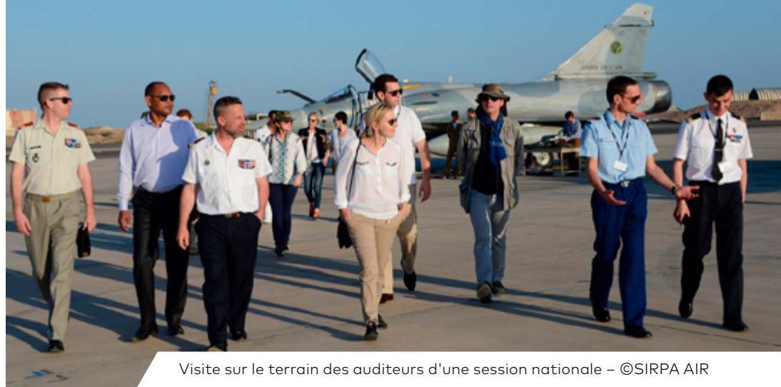
Visite sur le terrain des auditeurs d'une session nationale

SEPTEMBRE À JUIN – PARIS ET TERRITOIRE NATIONAL ≈ 50 AUDITEURS ≈ 60 JOURS / Jeudi et vendredi – Missions "Djibouti" – "Europe" – "Monde"