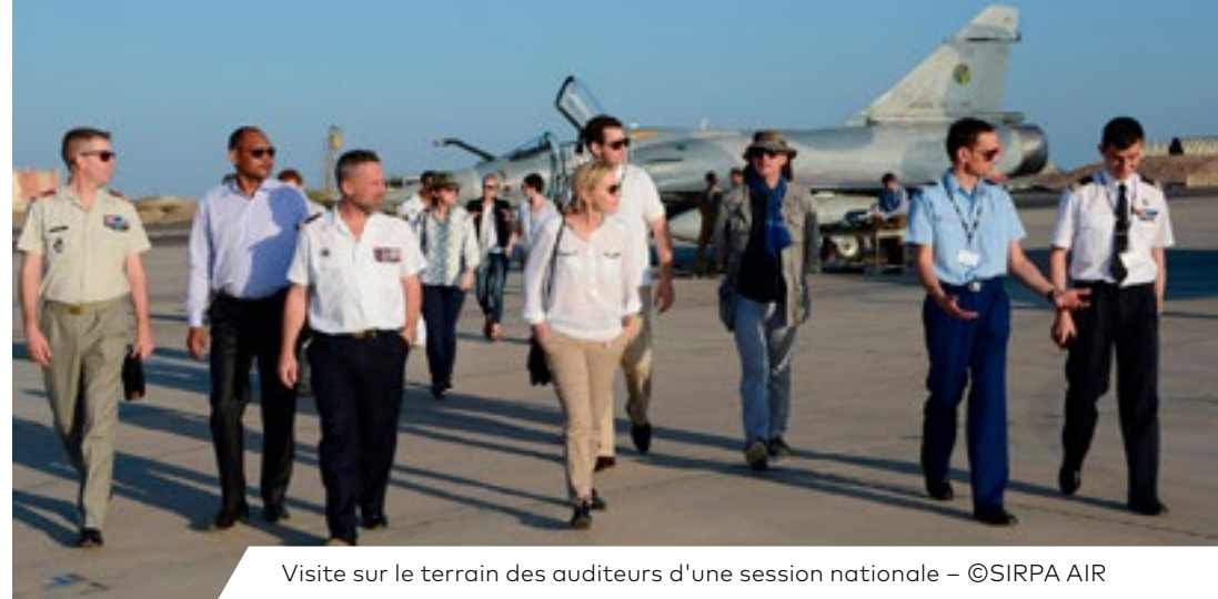
Visite sur le terrain des auditeurs d'une session nationale

SEPTEMBRE À JUIN – PARIS ET TERRITOIRE NATIONAL ≈ 50 AUDITEURS ≈ 60 JOURS / Jeudi et vendredi – Missions "Djibouti" – "Europe" – "Monde"